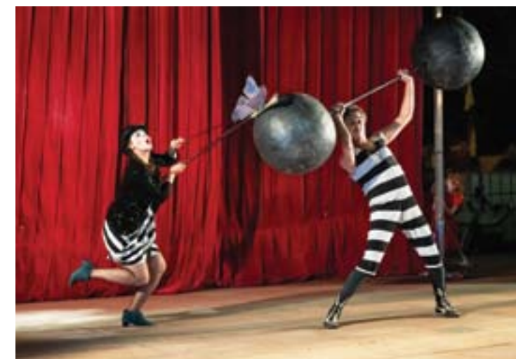
Teatr Klinika Lalek