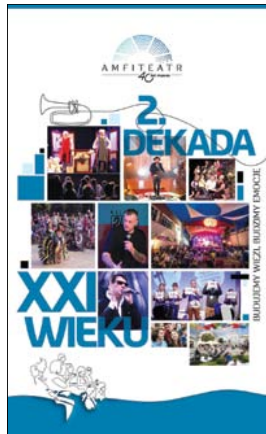
Plakaty jubileuszowe, przygotowane przez MOK „Amfiteatr”

większych koncertów w mieście. Warto dodać, że pieniądze na jubileuszowe obchody pochodzą z Budżetu Obywatelskiego.