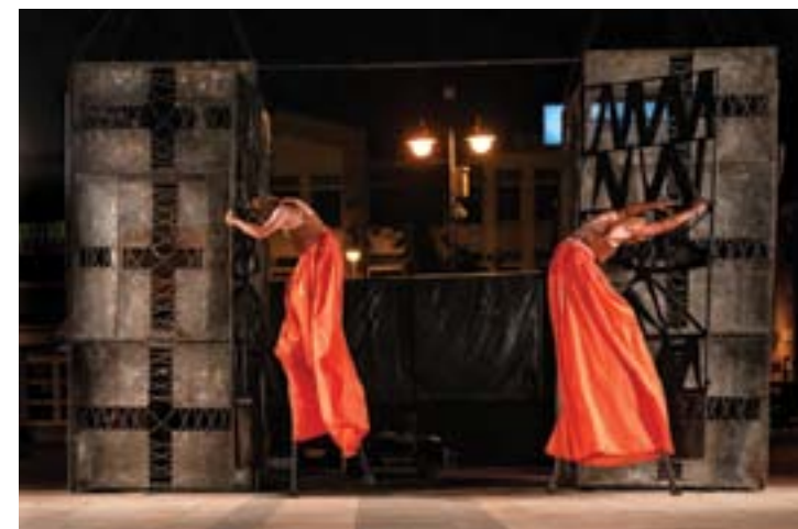
Teatr Biuro Podróży

Projekt „Ulica Teatralna” okazał się sukcesem – w dobie pandemii najlepiej zdały egzamin działania plenerowe. A Teatr Powszechny w Radomiu już zaprasza na XIV Międzynarodowy Festiwal Gombrowiczowski.